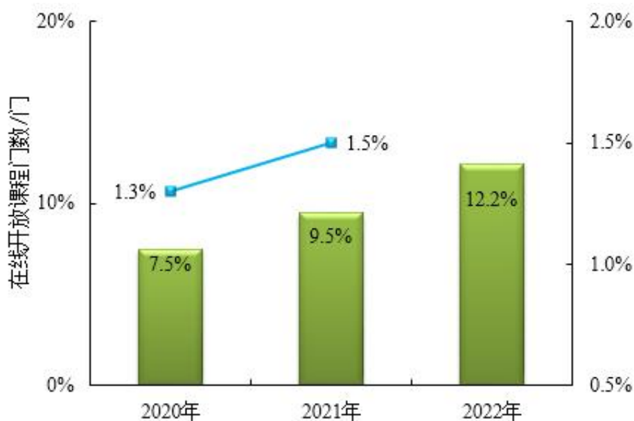
图 6 2021 年-2022 年合作企业融合情况增长率